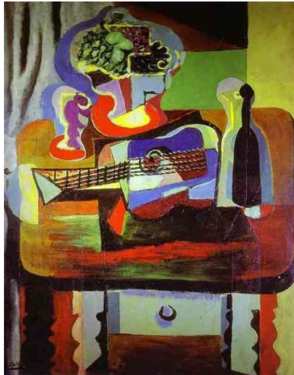
P. PICASSO – Gitaar, fles, fruitschaal en glas op tafel